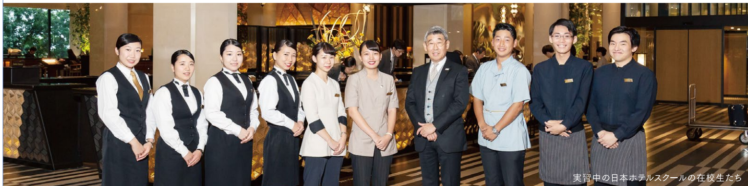
実習中の日本ホテルスクールの在校生たち