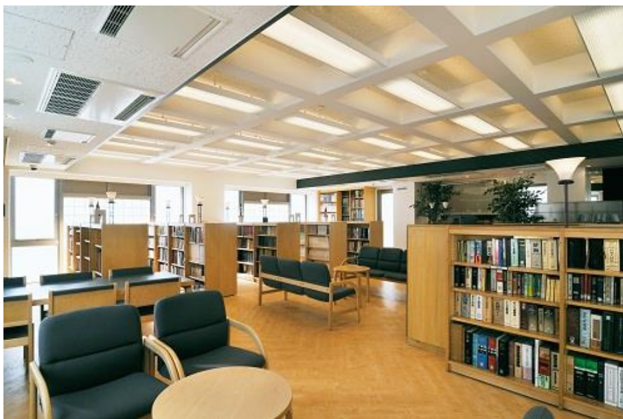
専門学校日本ホテルスクール 本館 4 階 図書資料室

専門学校日本ホテルスクール（所在地：東京都中野区 理事長・校長：石塚 勉）は、教育環境整備の一環として図書資料室の整備を進めています。本校校舎の 4 階にある図書資料室は、観光・ホテル・ブライダル分野に関連する書籍や観光関連団体や関連省庁の発行する資料及び報告書類を専門的に収集し、収蔵しています。7 月 1 日現在、図書資料室には新規購入書籍類を含めて収蔵書籍 8,690 冊の他、月刊業界誌など約 2000 冊の合計 10,000 冊以上を本校の学生への学習環境の一部としてゼミなどの資料の提供や啓蒙機会、就職活動における企業研究などにも役立つような書籍以外の参考資料などの閲覧を可能な環境に整えています。