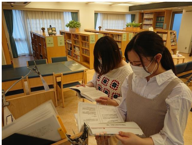
可動式ファイルラックの資料を参考にする学生