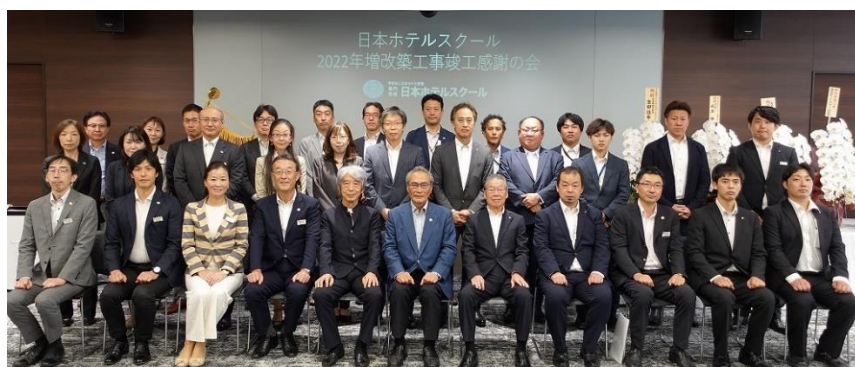
新校舎竣工感謝の会 本校関係者と設計者、施工者の皆さん