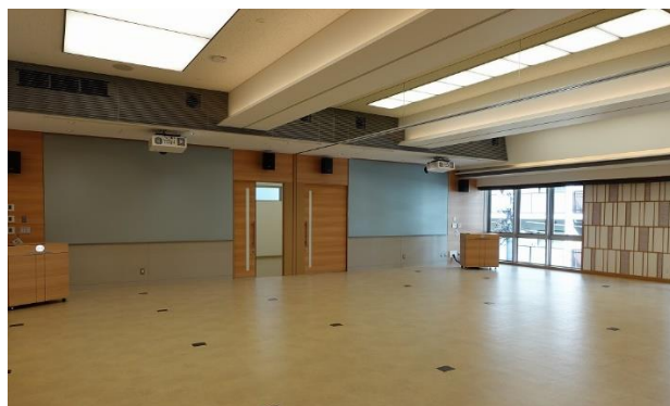
新校舎 4階テラス／学生と教職員の交流の場 (左)