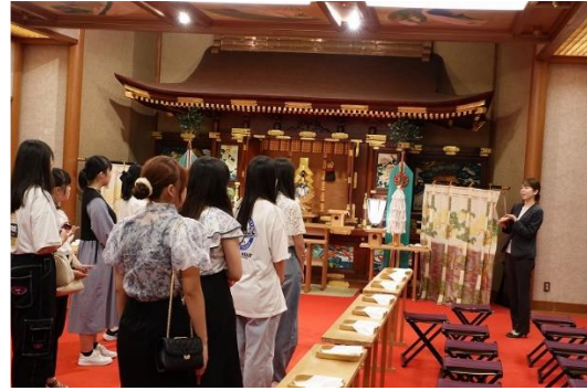
ブライダルイベント チャペルでの模擬挙式(左) 絢爛豪華な神殿の見学(右)

同ホテルで活躍する現役のウェディングプランナー、ドレススタイリスト、サービスキャプテンの方へのインタビューでは、それぞれの仕事紹介、やりがい、お客様との心に残るエピソードなどを披露していただきました。参加者は ブライダルの仕事を明確にイメージできただけではなく、人生の門出となる結婚式の仕事の魅力を感じることができた貴重な機会となりました。