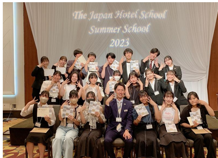
3日間ともに過ごした同じ夢を持つ仲間とのクラス写真

参加者の皆さんからは、「あっという間の3日間で自然とみんなと仲良くなれて嬉しかったです」「新しいことをたくさん学ぶことができ、自分の夢への1歩になりました」「入学後のイメージができ、より日本ホテルスクールに入学したいと思いました」など感想をいただきました。