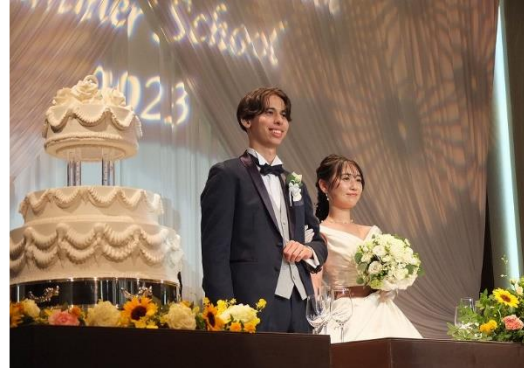
模擬披露宴会場のテーブルセッティング ホテルでの体験(左) 披露宴 新郎新婦及びスタッフは在校生が務めました(右)