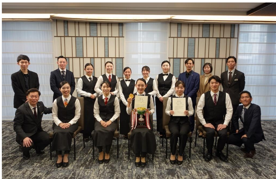
JHS 杯 出場者 10 名と審査員を務めた卒業生、教職員