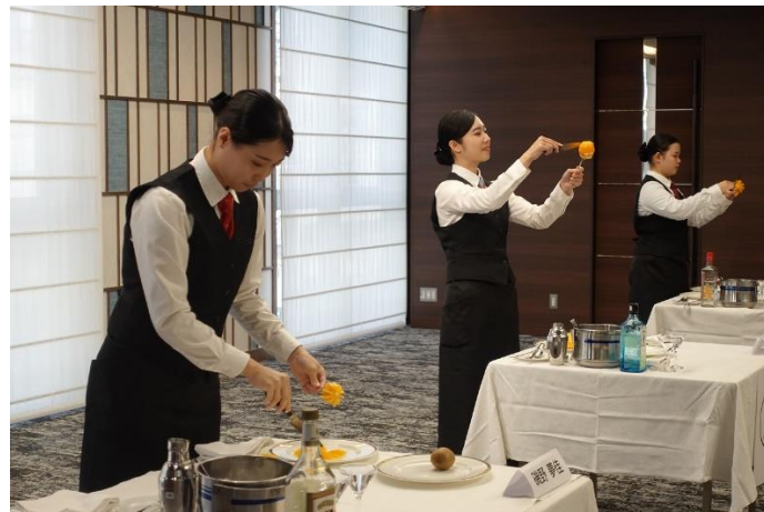
JHS 杯の様子／課題に取り組む出場した学生ら